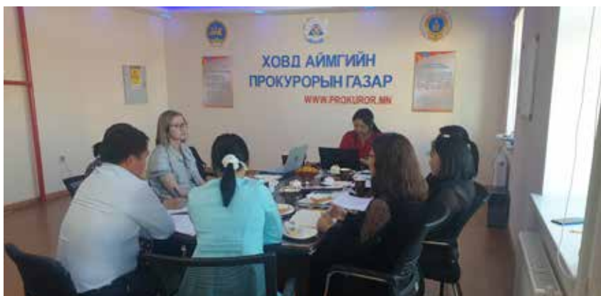
Судалгааны баг Ховд аймгийн прокурорын газарт ажиллаж байгаа нь.