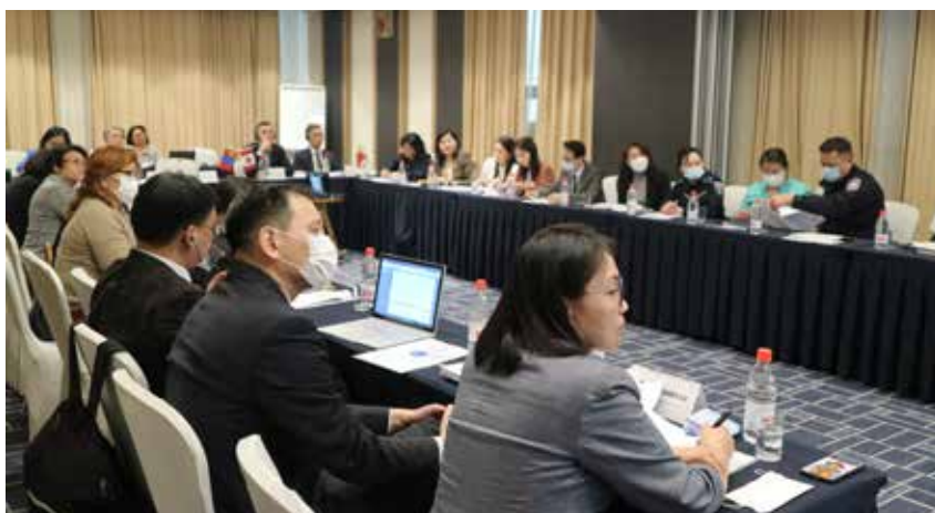
Судалгааны товч тайлангийн хэлэлцүүлэгт оролцож буй хууль сахиулах болон шүүх эрх мэдлийн байгууллага, иргэний нийгмийн байгууллагуудын төлөөлөл.