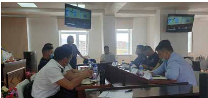
Судалгааны баг Сонгинохайрхан дүүрэг дэх цагдаагийн хэлтэст ажиллаж байгаа нь.